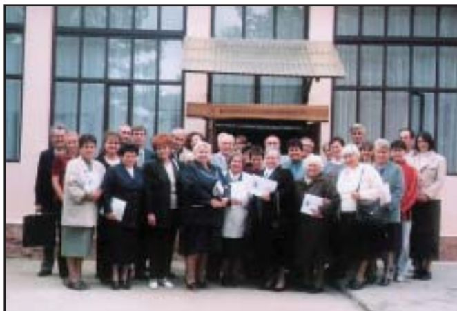
Az Ady Endre Iskola egykori és jelenlegi pedagógusai együtt ünnepeltek.