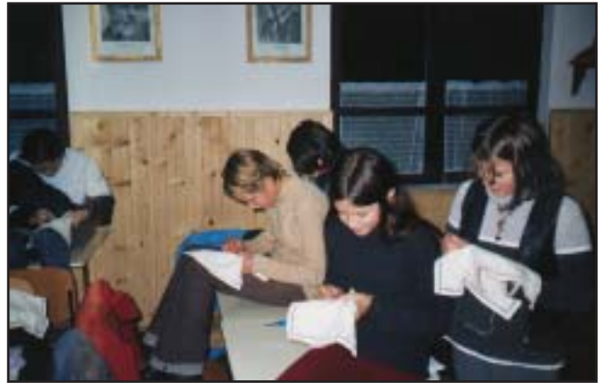
A ma elvégzett munka jövőt formál.