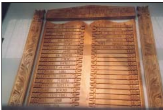
A Pedagógusok Tisztelet Táblája