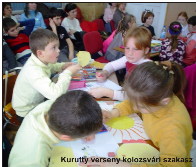
Kurutty verseny kolozsvári szakasz

Február a farsang hónapja, az álarcosbálok ideje. Az iskolások, óvodások számtalan ötletes jelmezt öltöttek magukra s vidáman temették a telet.