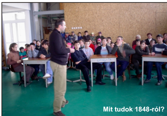
Mit tudok 1848-ról?