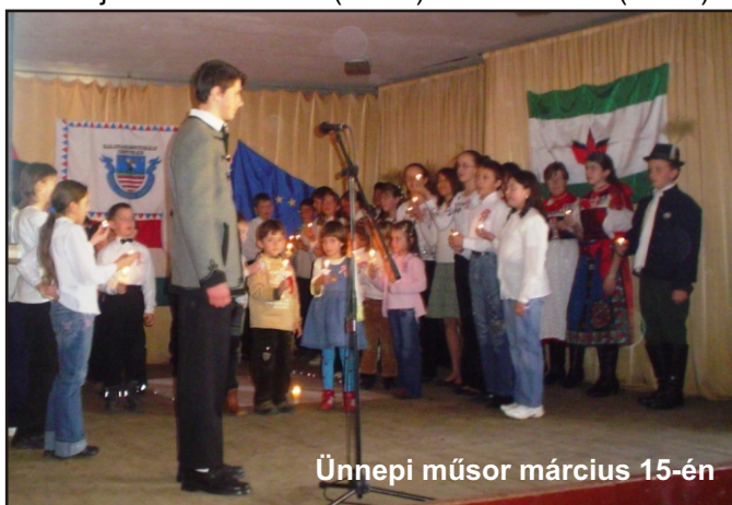
Ünnepi műsor március 15-én