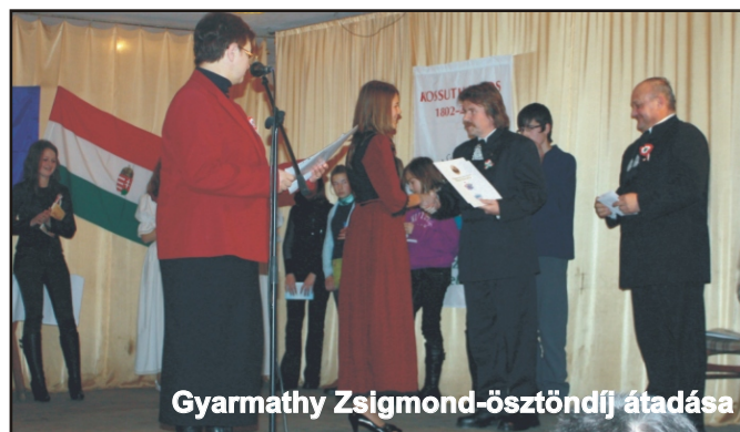
Gyarmathy Zsigmond-ösztöndíj átadása