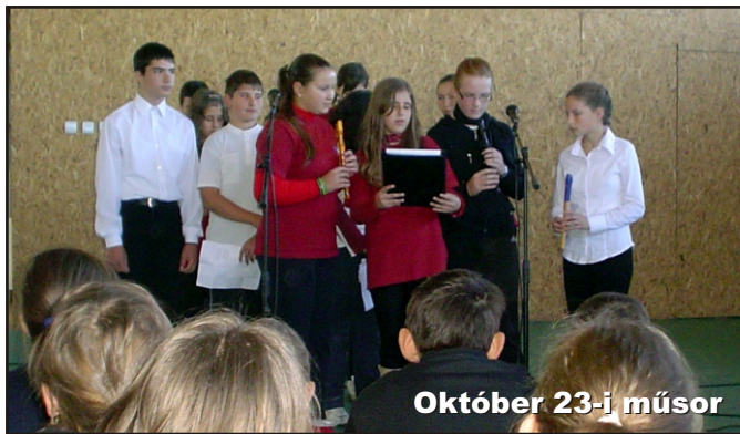
Október 23-i műsor

● A Mikulásjárás idén is tetszést aratott az I–VIII. osztályosok körében. A Mikulás elmondása szerint viszont az óvodások meglepődtek, és sírni kezdtek a nem minden nap vendég láttnán.