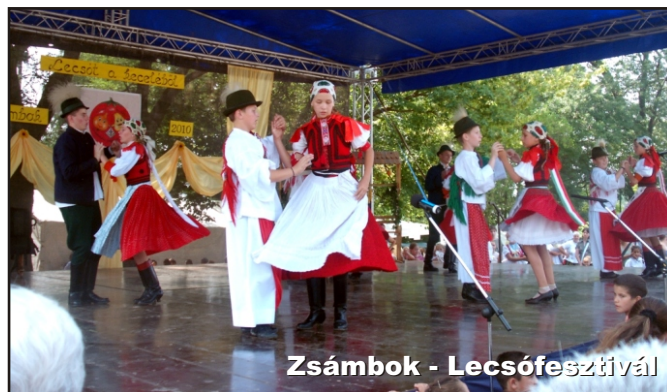
Zsámbok - Lecsőfesztivál

● Irány az EU címmel iskolai szintű verseny zajlott novemberben, a nyertes 12 tanuló 3 pedagógussal jövő év februárjában Brüsszelbe utazik Winkler Gyula képviselő támogatásával.