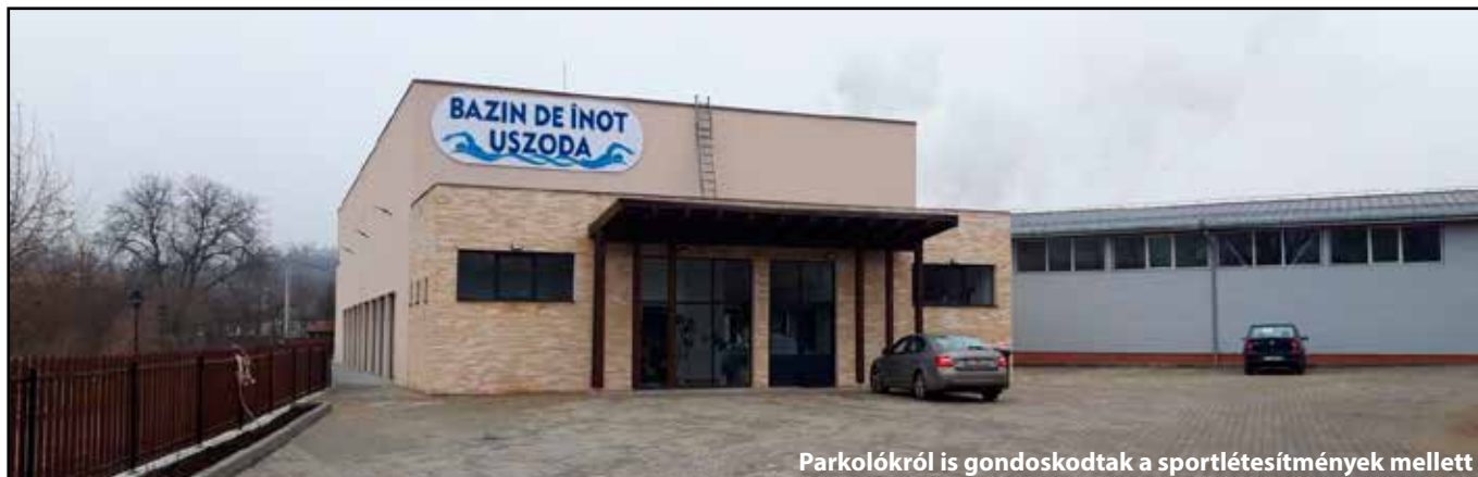
Parkolókról is gondoskodtak a sportlétesítmények mellett