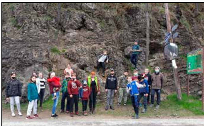
A Csigahegy lábánál

Mielőtt viszont a szállásra értünk, meglátogattuk a PISOAIA nevű vízesést és a Csigahegyét. Ez a két hely szinte egymás mellett helyezkedett el.