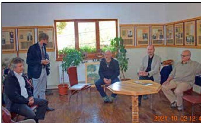
Kerekasztal-beszélgetés az Ady-szobor helyéről