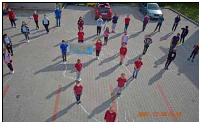
Mozdulj a klímáért akcióját

A délután során megismerkedtünk a szállásunkkal és pihentünk volna, mert esett az eső, de arra nem volt időnk. Mindenki tudja, hogy milyenek vagyunk mi gyerekek, tehát a pihenés helyett inkább sárfociztunk. Ez egészen estig elhúzódott, vacsora után még későig játszottunk és izgatottan vártuk a következő napot.