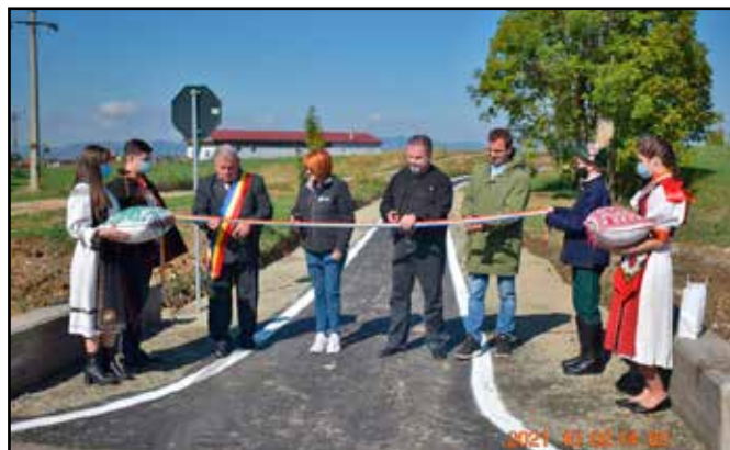
Jó úton. Nemrég adták át a 4 kilométeres kerékpársávot a kalotaszegi községben • Fotó: Ady Endre Kulturális Egyesület

A mintegy 15 kilométeres szakaszból egyelőre a négy kilométeres kalotaszentkirályi biciklisáv készült el, amihez