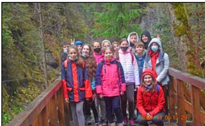
Kirándultunk a VI. osztállyal