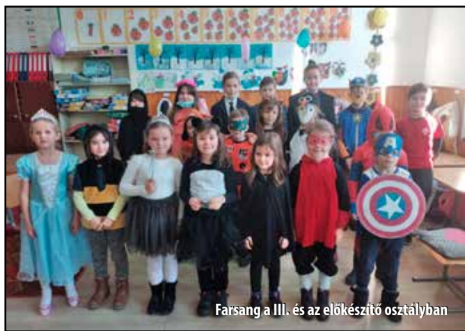
Farsang a III. és az előkészítő osztályban