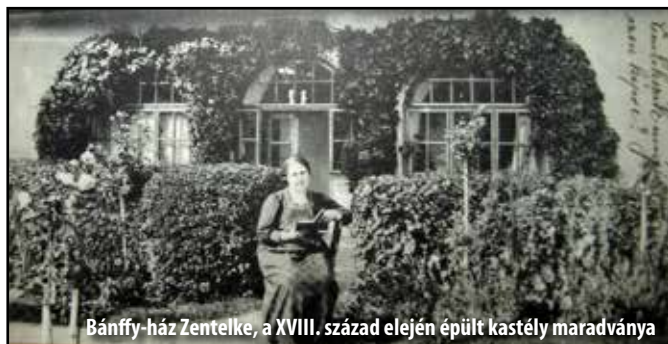
Bánffy-ház Zentelke, a XVIII. század elején épült kastély maradványa