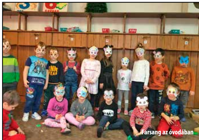
Farsang az óvodában

Az elmúlt napok rettentően eseménydúsak számomra. Ezt a levelet is legfőképpen azért írtam, hogy megosszam veled a fejemben kavargó gondolatokat, szerintem a te érdeklődésed is majd felkeltik. De egy szó, mint száz bele is kezdenék a mesélésbe, nagyon remélem, hogy élvezettel és kíváncsisággal olvasod majd a következő soraimat.