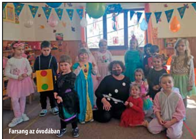
Farsang az óvodában