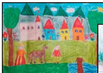
Mátyás király nálunk járt