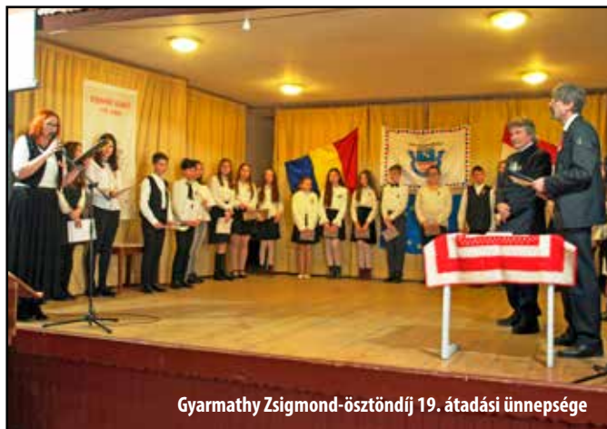
Gyarmathy Zsigmond-ösztöndíj 19. átadási ünnepsége

„Dolgozni csak pontosan és szépen, ahogy a csillag megy az égen, úgy érdemes.”