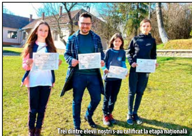
Trei dintre elevii noștri s-au calificat la etapa națională