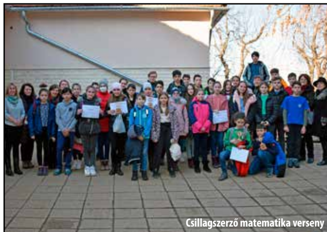
Csillagszerző matematika verseny

Külön cikk foglalkozik a Gyarmathy Zsigmond Ösztöndíjjal, melynek a kiosztására újra sor kerülhetett hagyományos keretek között. Itt köszöném meg újra a támogatóinknak az anya-