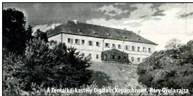
A Zentelkei kastély Digitális Képtárház, Hány Gyula rajza

századi erdélyi összeírások és leltárak című munkája közli 1715-ből a zentelkei Bánffy Farkas összes urbáriumát. Az 1700-as években gróf Bánffy György gubernátor is kastélyt épített Zentelkén a bonchidai kastéllyal egyidőjét, így a 19. század elején két udvarház/kastély is állt a településen: egy a Romban, másik az Udvarban. Mindkettő elpusztult 1848-ban. A Romban levő telken pincék őrzik a Bánffy-múltat, hisz azt nem építették újjá, de a zentelkei Kántor-malom (ma Kántor Lajos fiának a tulajdona) is ennek az uradalomnak volt a tulajdonában. Az udvari kastély a katolikus Jósikák kezére került, mely 1848-ban csak részben pusztult el. A ma gazdatiszti lakásként emlegetett barokk épület (Bánffy-ház) ennek a 18. század elején épült udvarháznak a megmaradt része.