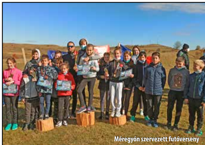
Méregyön szervezett futóverseny