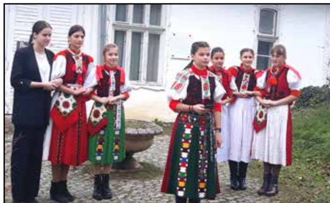
Megemlékező ünnepély a Boncza-kastélynál