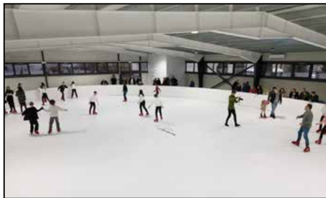
Diákok a korcsolyapályán

Folyamatban van a földgázhálózat kiépítése is. A tájékoztatás szerint a beruházás értéke 8 millió euró, amelyet az Anghel Saligny Nemzeti Program részeként finanszíroznak. A projekt Magyarókeréke, Malomszeg, Kalotadámos, Jákótelke és Kalotaszentkirály települések földgázellátását feltételezi. A mérőállomással rendelkező hálózat teljes hossza több mint 31 km lesz, a több mint 1000 csatlakozást és mérőblok-