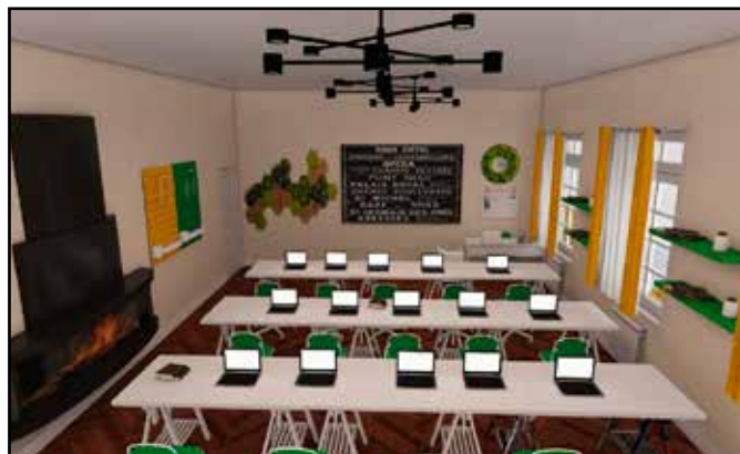
Az informatikai labor látványterve

A projekt értéke több mint 300.000 euró vissza nem térítendő támogatás. A támogatásból bútorzattal, didaktikai anyagokkal, digitális eszközökkel gazdagodnak a következő iskolai terek: egy informatikai labor, 13 tanterem (óvodai, ele-