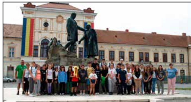
Zilahon, a Wesselényi-szobornál

ták a hét során készített videóikat, valamint finom bográcsgulyással és tortával ünnepeltük a tábor 20 éves fennállását.