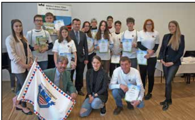
Blankók és Brokoli Trió