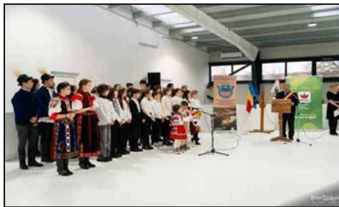
A műjégpályát elsősorban az iskolások használják majd

A 700 ezer eurós befektetéshez 200 ezer eurós európai uniós támogatást kapott a helyi önkormányzat, a fennmaradó összeget saját költségvetéséből biztosították. A szintetikus jéggel ellátott fedett építmény összterülete 600 négyzetméter, amelyből 340 négyzetméter a csúszófelület. Az épület emellett rendelkezik öltözőkkel, mellékhelyiségekkel, elsősegélynyújtásra, illetve a korcsolyák tárolására