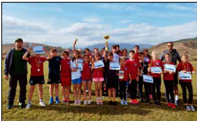
14 év alatt 13-szor végzett az Ady Suli első helyen a területi futó bajnokságon