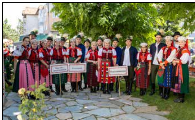
A Kalotaszegi Magyar Napokon is képviseltük falunkat

Ezt követően szerveztünk egy Felszeg Gyöngye találkozót, ahol igyekeztünk minden generációnak kielégíteni az igényeit és számukra megfelelő programokkal készültünk, kitöltve így egy teljes napot. A személyes kedvencem a legapróbb gyöngyök programja, a baba-mama program volt, ahol az anyukák és babáik egy tartalmas órát tölthettek el ismerkedve a ritmus, népzene és gyerekdalok világával. A következő egy órában az óvodásoké volt a terep, ahol a tánc-táborból már jól ismert gyerekjátékok és dalok csendültek fel. Ezt követően a nagyobbakkal gyakoroltuk a táncórán is alkalmazott ritmusgyakorlatokat és körjátékokat. Nem feled-