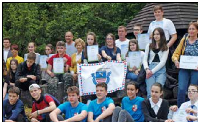
Kárpát-medencei döntő, Budapesten