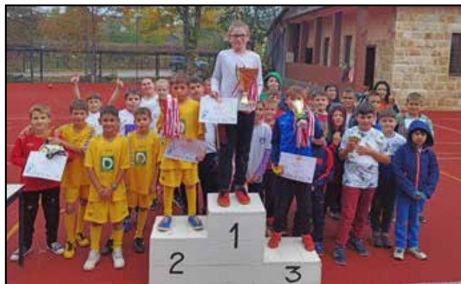
„Kicsik Nagy csele” – a 2023-as Ady-kupa díjazottjai