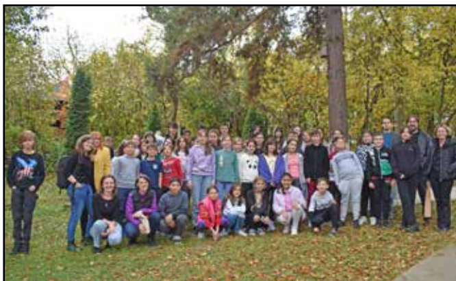
Csoportkép a Helikon munkatársaival