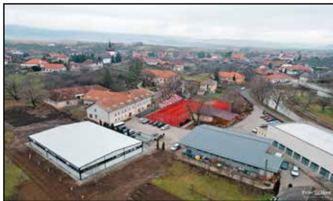
A jégpálya az iskola campusán, a medence és a tornaterem mellett található

mációs modulokból álló intelligens utcabútort szereznének és üzemelnének be. Emellett két töltőállomást üzemelnek be az elektromos járművek számára.