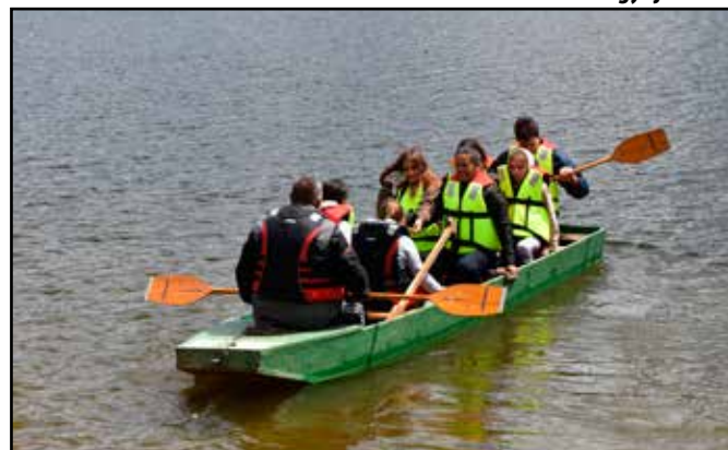
Kirándulás a Jósikafalvi gyűjtőtőhöz