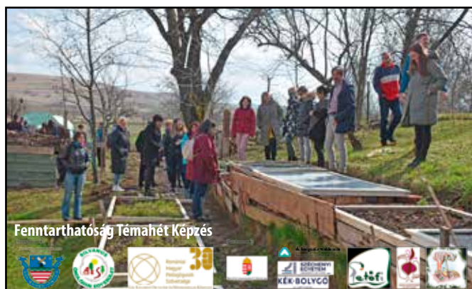
Fenntarthatóság Témahét Képzés

Kedves olvasók, kérjük, kövessék tevékenységeinket az iskola Facebook oldalán: https://www.facebook.com/adyendre.iskola.7