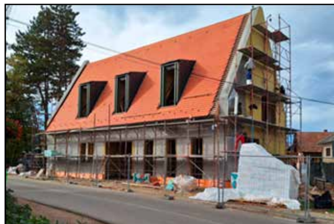
Épül az új kultúrotthon