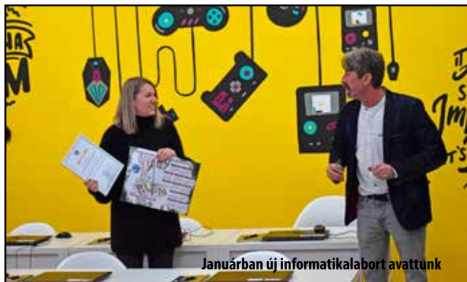
Januárban új informatikalabort avattunk