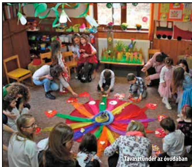
Tavasztündér az óvodában

Az óvodában rendhagyó módon ünnepeltük a nők napját. Tavasztündér látogatott el hozzánk és a tavasz színeit hozta ajándékba a gyerekeknek. Miközben megpróbáltuk megfejteni, melyik szín hogyan is jelenik meg a természetben, megfigyeltük, hogy milyen gondoskodó környezetre is van szükségük a növényeknek ahhoz, hogy fejlődni tudjanak, mint a földre, mely tápálékot nyújt, napfényre, mely meleget ad, vízre és levegőre. Így értették meg a gyerekek, hogy nem csak a növényeknek van szükségük gondoskodásra, hanem nekik is, és ez a gondoskodás nem más, mint a szülői szeretet. Hogy kifejezzék hálájukat az édesanyáknak, lelkesen szavalták el a kedves köszöntőket és énekelték el az énekeket. Majd miután padlóképekben kifejezték, hogy mivel ajándékoznák meg édesanyjukat, átadták a nagy szeretettel készített képeslapokat is az édesanyáknak és nagymamáknak.