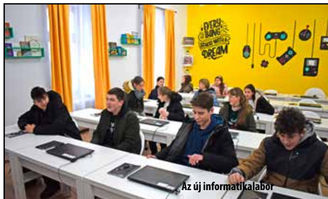
Az új informatikalabor