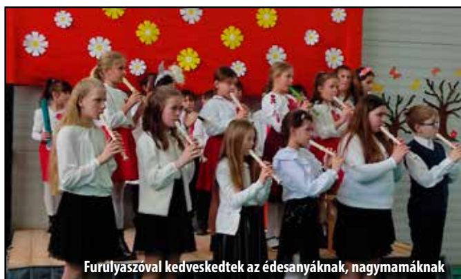
Furulyaszóval kedveskedtek az édesanyáknak, nagymamáknak