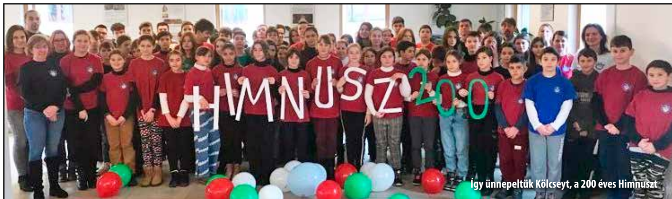
Így ünnepeltük Kölcseyt, a 200 éves Himnuszt

kájukat azonban évfolyamonként külön értékeljük. Az első négy forduló otthoni feladatmegoldáson, kidolgozáson alapul. A megoldásokat tartalmazó dolgozatokat határidőre kell beküldeniük a verseny szervezését vállaló iskolába.