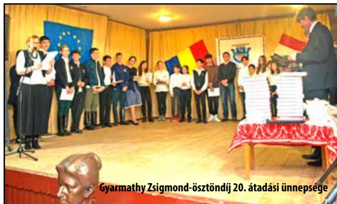
Gyarmathy Zsigmond-ösztöndíj 20. átadási ünnepsége

Gyarmathy Zsigmond Ösztöndíj átadási ünnepségével kapcsolatosan történtek egyeztetések.