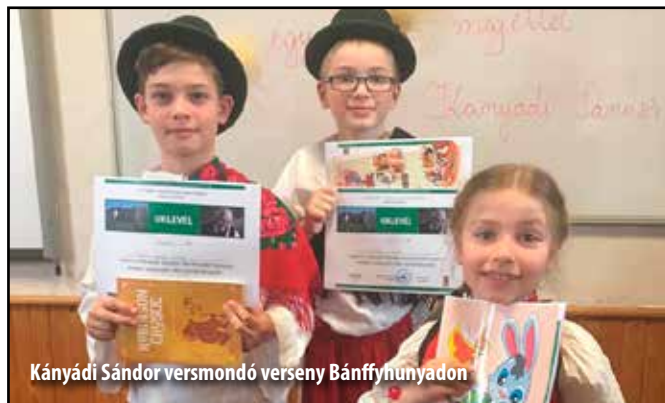
Kányádi Sándor versmondó verseny Bánffyhunyadon