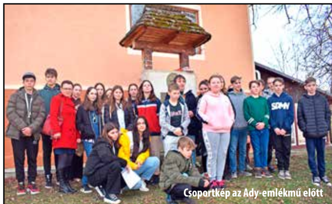
Csoportkép az Ady-emlékmű előtt