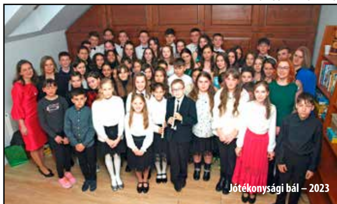
Jótekonysági bál – 2023