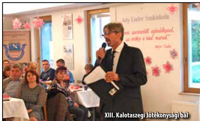
XIII. Kalotaszegi Jótékonyági Bál

A polgármesteri hivatal támogatásával egy nagyobb horderejű pályázat lett letéve a PNRR alaphoz. Ezáltal új bútorzat vásárlására lesz lehetőség, a laborfelszerelések száma bővíthető, műhelyek jöhetnek létre.