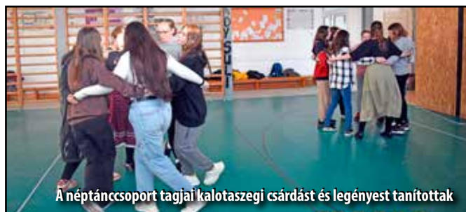
A néptáncsoport tagjai kalotaszegi csárdást és legényest tanítottak