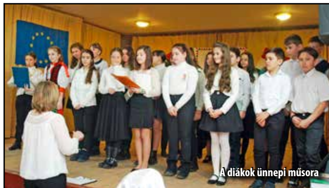
A diákok ünnepi műsora