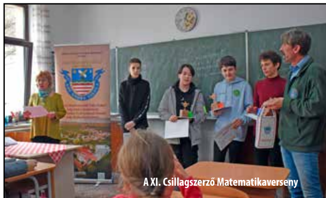
A XI. Csillagszerző Matematikaverseny