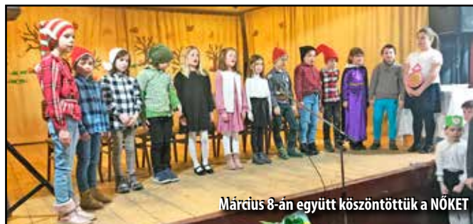
Március 8-án együtt köszöntöttük a NŐKET